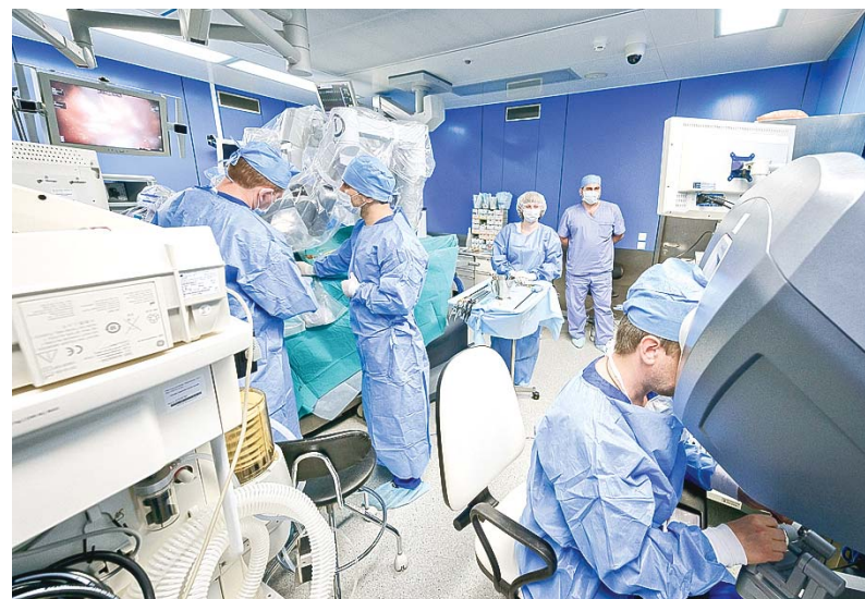
Мастер-класс с применением роботизированного хирургического комплекса Da Vinci

веческого организма. Это вполне разрешимая задача.