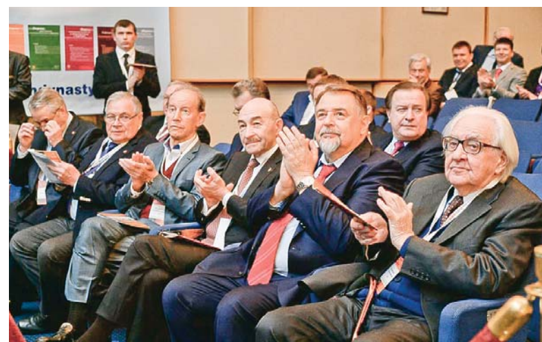
Заседание конгресса проходило с активным участием ведущих учёных России

Ещё одно из важных направлений, которое мы активно развиваем, – использование новейших технологий и разработок в реабилитации. В частности, в рамках мастер-класса мы демонстрировали программу реабилитации больных после эндопротезирования круп-