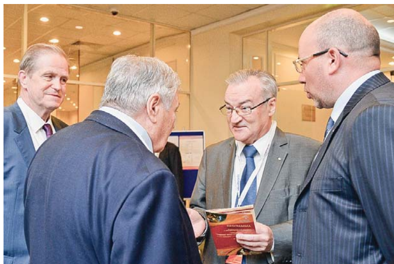
В перерыве между заседаниями

– Конгресс проводился при поддержке Минздрава России, который заранее включил его в список основных научных мероприятий года,