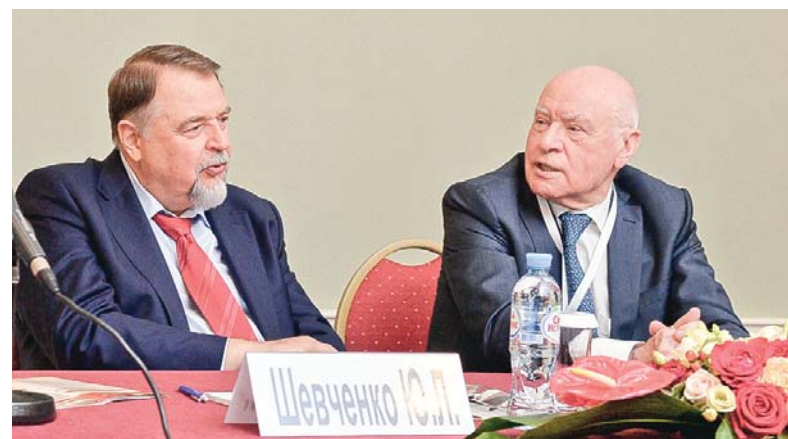
Кардиохирургическая секция (академики Ю. Шевченко и Л. Бокерия)

Обсуждение проходило в реальном режиме с одномоментными трансляциями из разных операционных. Состоялось несколько тематических мастер-классов, уникальность которых определялась технологиями, задействованными в процессе их выполнения. Бригадой наших специалистов и коллег из Санкт-Петербурга выполнялась роботассистированная операция на цитовидной железе. Показателем был также мастер-класс в эндоскопической операционной. Наши врачи продемонстрировали эндоскопическую кардиомиотомию при ахалазии кардии. Надо отметить, что при помощи гибкой эндоскопии