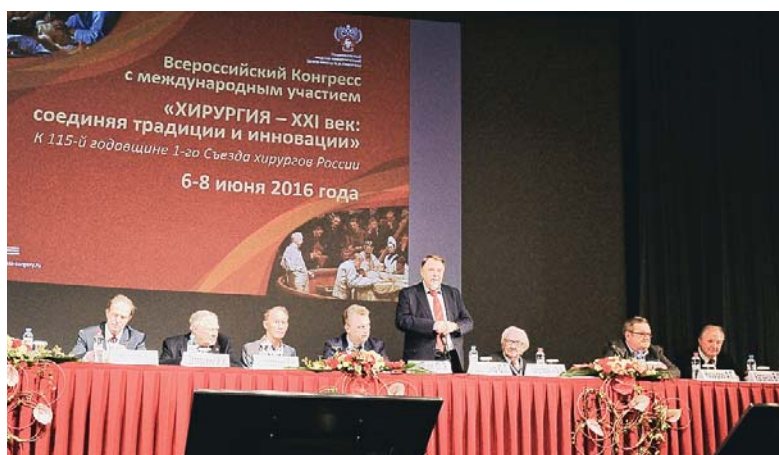
Президиум Всероссийского конгресса хирургов

Было проведено более 20 секционных заседаний, тематическая направленность которых простиралась от современных достижений в области хирургических и миниинвазивных технологий, высоко-