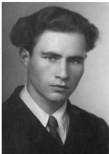
Студент Рязанского медицинститута