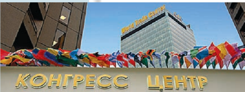
World Trade Center Moscow 123610, Russia, Moscow, Krasnopresnnskaya nab., 12